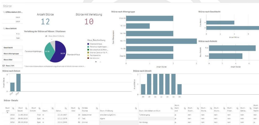
▲ Dashboard Stürze